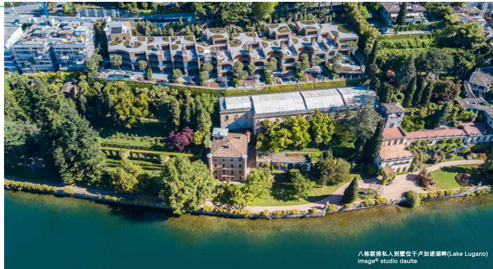
八栋联排私人别墅位于卢加诺湖畔(Lake Lugano)