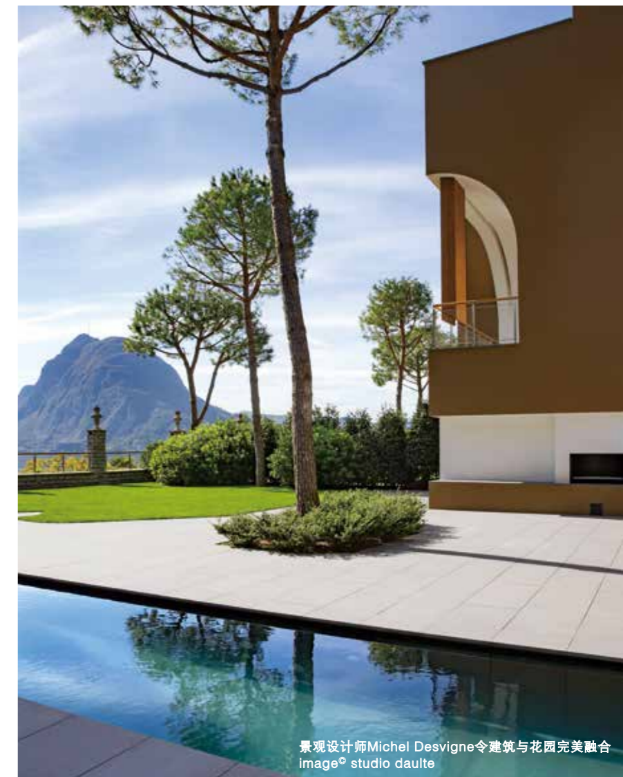
景观设计师Michel Desvigne令建筑与花园完美融合

Villa Favorita坐落于Monte Bré山脚下，至今仍是保存最完整的17世纪花园之一。从1687年至1932年间，13栋浪漫主义建筑群在此陆续修建，别墅带有标志性的提契诺派风格，而事实上，当时意大利北部湖畔别墅的风格大多如此。直到20世纪下半叶，这里才陆续建造起一些现代化住宅，它们依然延续了典型的提契诺风格建筑设计，以呼应其作为瑞士意大利语区的文化传统。2009年，投资方委托Herzog & de Meuron在此打造全新的